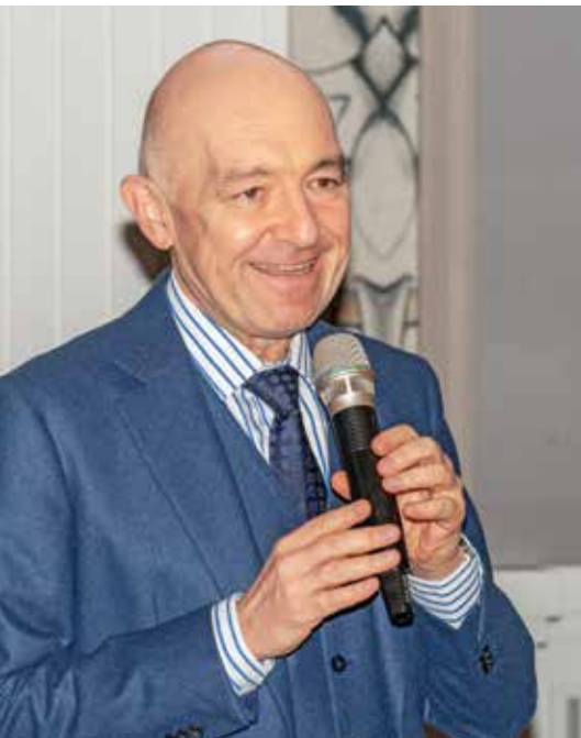
Der Präsident des Kaufmännischen Verbands Schweiz, Daniel Jositsch (Prof. Dr. iur., Ständerat Kanton Zürich), begeisterte die Gäste am Herbstanlass kfmv Aarau-Mittelland.