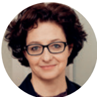
Vera Class Nationaler Lead wbp